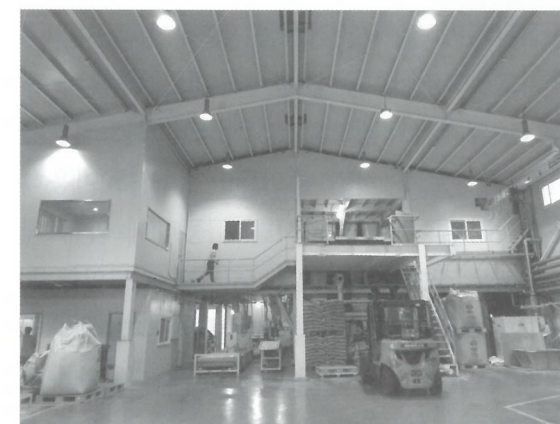
▲ 자돈 사료공장 내부 전경

해 국민 행복도에 기여하겠다는 기업의 사명의식이 있었기에 가능했다. 양돈사료만을 전문으로 하는 ‘피그넷코리아’는 지난 2007년 충북 충주시 신니면에 자돈사료 전문공장을 처음 설립한 이래 고객 농가의 요구에 부응해 지난 2015 충북 음성군 금왕읍에 큰돼지 사료 전문공장을 설립해 오늘에 이르고 있다.