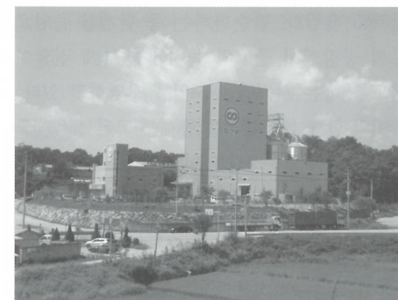
▲ 큰돼지 사료공장 외부 전경